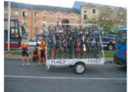
Photographie US Créteil Cyclotourisme.

Cette belle randonnée s'est déroulée sous le soleil, quelque fois arrosée d'une pluie d'orage. Environ 3000 participants quittaient dès 6 H 30 le gymnase Marcel Cerdan à Levallois pour rejoindre Honfleur. Les plus véloces arrivèrent à partir de 13 h 45 et les derniers vers 17 h 45.