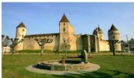
Le château de Blandy-les-Tours, l'un des contrôles

Il n'est peut-être pas inutile de préciser qu'un nombre important de touristes à vélo est incapable de se diriger avec pour seule aide une carte routière. Certains, se livrent à un étrange mixage des points cardinaux, tandis que d'autres ont fâcheusement tendance à confondre la droite et la gauche, un acte de réversibilité seulement admis en surprise, c'est l'ignorance des matières d'évaluation de Interrogés sur le sujet dans les réponses, propre au rallye, moindres – n'ont pas hésité à l'époque des vaches maigres considérés comme pessimistes. de courbes par excellence, graphiques, à illustrer la spec-