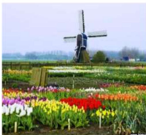
... un emblème devenu national

Relation sportive du "capitaine", Jan JANSSEN, qui venait tout juste de quitter le peloton des professionnels au terme d'une carrière riche en exploits, entamait une phase de récupération sur ses terres natales à Nootdorp. Il y invita les cyclotouristes cristoliens à l'occasion d'un week-end prolongé, celui de la Pentecôte. Ils furent 14 à répondre, à cette aimable invitation.