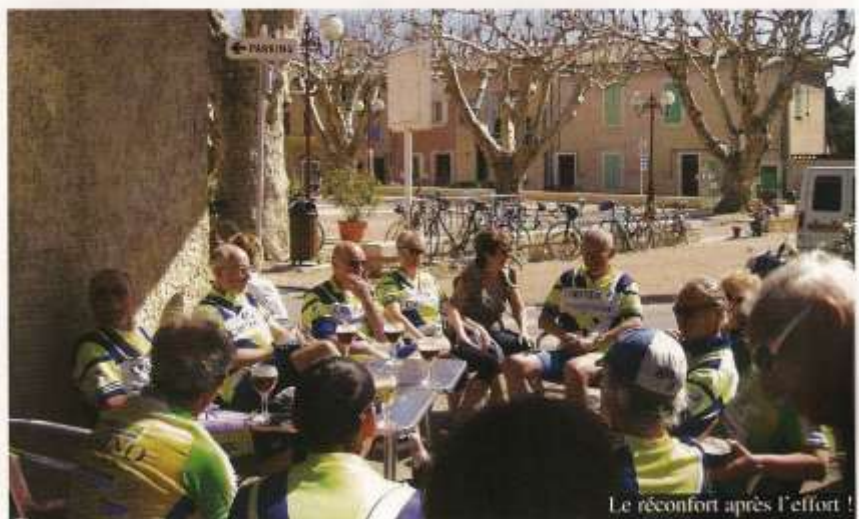
Le réconfort après l'effort !

Renseignements au 01 45 94 50 21 www.cyclotourisme.uscreteil.com