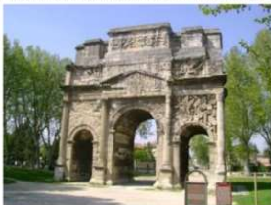
La Porte antique d'Orange