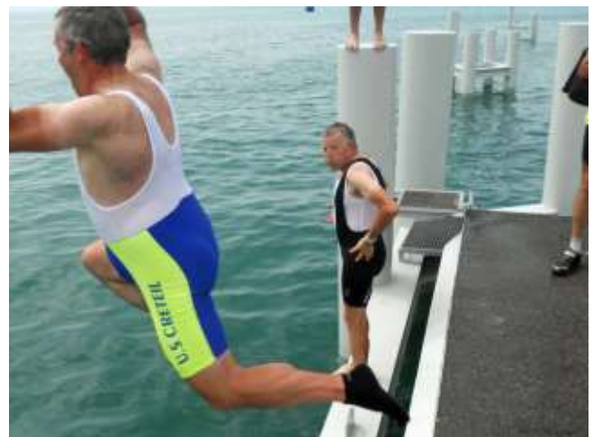
Après l'effort, le réconfort des eaux du Lac Léman.