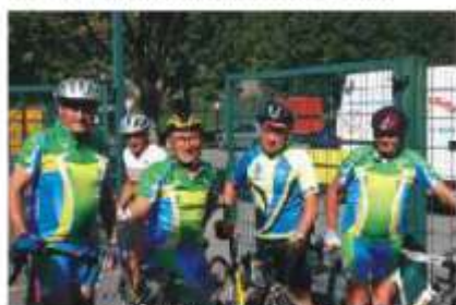
Nos amis de Naizin (Morbihan) à l'arrivée

Nos amis cyclotouristes Naizinois (Morbihan), avec lesquels nous avons scellé un pacte d'amitié en 2003, étaient venus nous rendre visite.