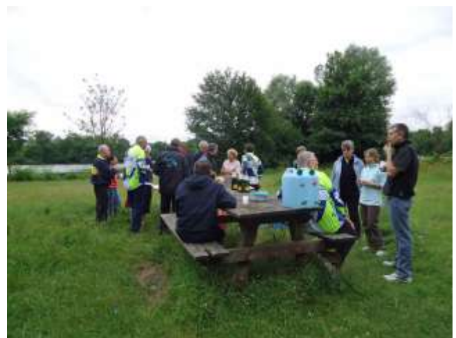
Une accalmie a permis un pique-nique au sec.

Correspondant : Roland TROCKIMO, photographies : US Créteil Cyclotourisme.