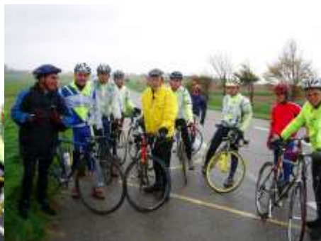
Le groupe au complet.