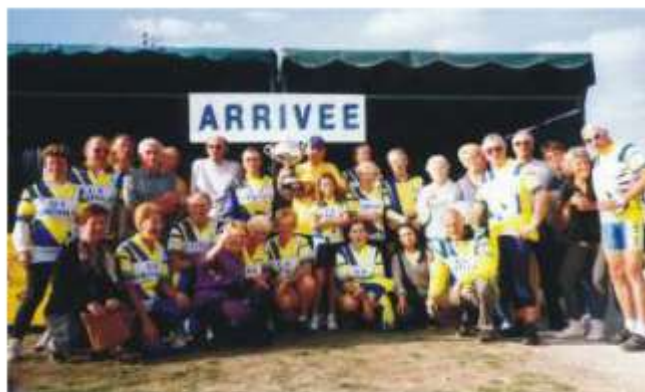
Les Cristolliens à l'arrivée du Rallye de Cosnes 2003.

remportait, pour la seconde année, le Challenge Cyclos, tous départements confondus, ce qui lui a valu, le lundi et le mardi suivants d'être cité dans le "Journal du Centre" et le "Régional de Cosnes". Le "Pouilly de l'Amitié" clôturait cette journée et, en bons sportifs, nos Cristolliens consommaient "avec modération"!