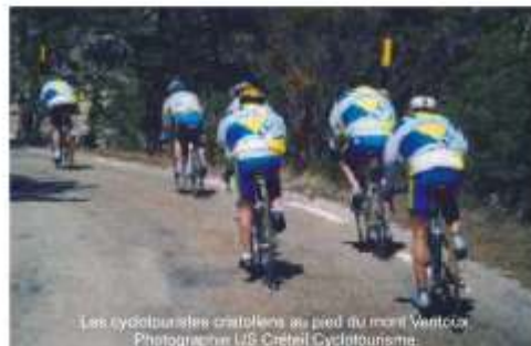
Les cyclotouristes cristoliens au pied du mont Ventoux

- Créteil-St Augustin-Créteil (115 km), avec un parcours vallonné, a regroupé 64 inscrits dont 7 femmes. Les cyclos Saint-Mauriens ont remporté la coupe devant les 22 autres clubs représentés.