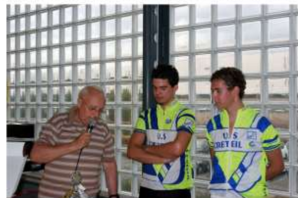
Les jeunes Vttistes.