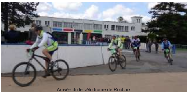
Arrivée du vélodrome de Roubaix.

Au programme, routes pavées, chemins de terre, quelques secteurs routiers et en plus, vent, pluie et froid qui se sont invités sur le parcours. Avis aux amateurs, avec un rendez-vous en 2015 pour une nouvelle participation.