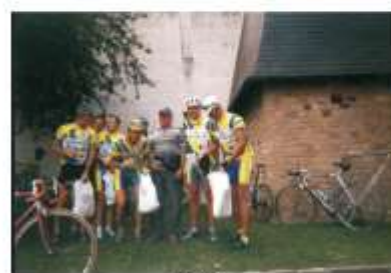
L'arrivée. Photographie USC Cyclotourisme.

Les Cristolliens, logés à 20 km de Quimper, n'ont pas profité des animations de la