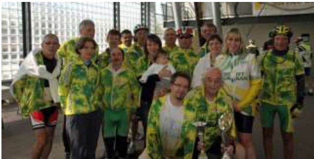
Le grand vainqueur du Challenge : l'AS Brévannaise.

Mission accomplie : avec 38 cristoliens inscrits aux différentes épreuves cyclos, VTT, et rando-pédestres, nous avons remporté pour la deuxième année consécutive le super