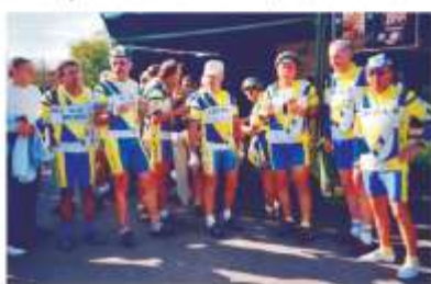
L'US Créteil Cyclotourisme, une forte participation au rallye de Cosnes-sur-Loire, le 12 octobre 2003.

Le cyclotourisme est un sport de loisirs et ne demande pas de préparation spécifique, par contre sa pratique est recommandée par le corps médical. Il sert de préparation aux pratiquants de sports d'hiver, aux lutteurs et en général aux sportifs qui ont besoin de jambes solides.