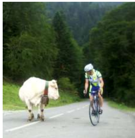
Rencontre inattendue au Col de Marie-Blanche dans les Pyrénées.

Pour célébrer cette 40 ème édition, la journée fut inondée de soleil ! Mais cela n'a pas suffi à amener la grande foule qu'on pouvait espérer. La participation des clubs voisins (28 clubs représentés dont 13 du Val-de-Marne) nous a toutefois