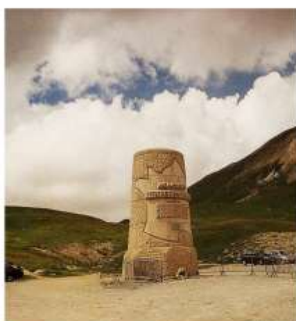
Le mémorial Henri DESGRANGE au sommet du Galibier

L'œil plus lourd de sommeil que le ciel de nuages, trois centaines de randonneurs occupaient, matériel en faisceaux, l'aire de la Bastille où l'organisateur grenoblois avait mobilisé tout ce que le cyclotourisme national compte de conquérants de haut sommets. Dans le cadre du Brevet de Randonneur des Alpes (BRA) il s'agissait d'attaquer de front la redoutable trilogie alpestre : la Croix de Fer d'abord, le Télégraphe ensuite et enfin l'indomptable Galibier précédé par ses quelque vingt kilomètres d'escarpement et plus d'un siècle de légende. Sans hâte ap-parente, ces chevaliers du ciel apportaient une dernière re-touche à un complexe physique-moral qui devait leur permettre de vaincre cette trilogie de géants au terme d'une chevauchée longue de 245 kilomètres.