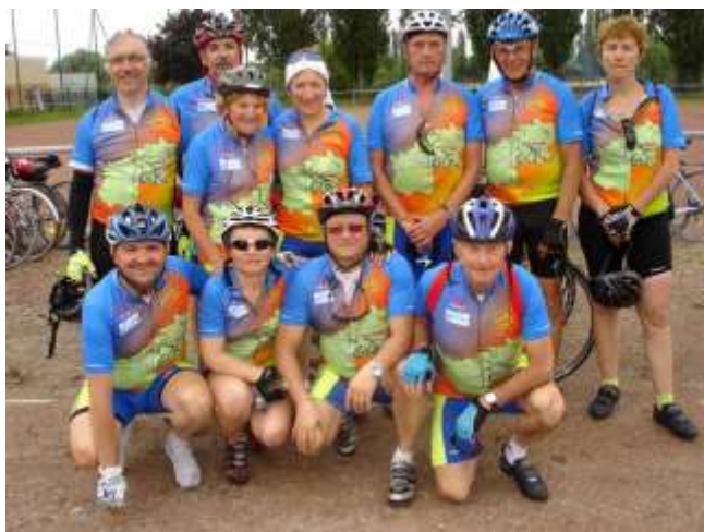
Les participants de l'US Créteil au Festival de l'Oh 2010.