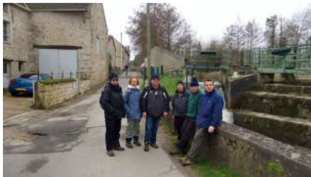
L'ancien moulin à Breuillet.

Correspondant : Roland TROCKIMO.