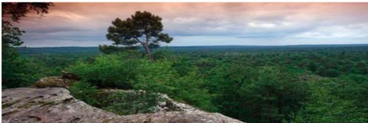
Le Rocher Cassepot, (haut) lieu de l'arrivée du Rallye Paramé