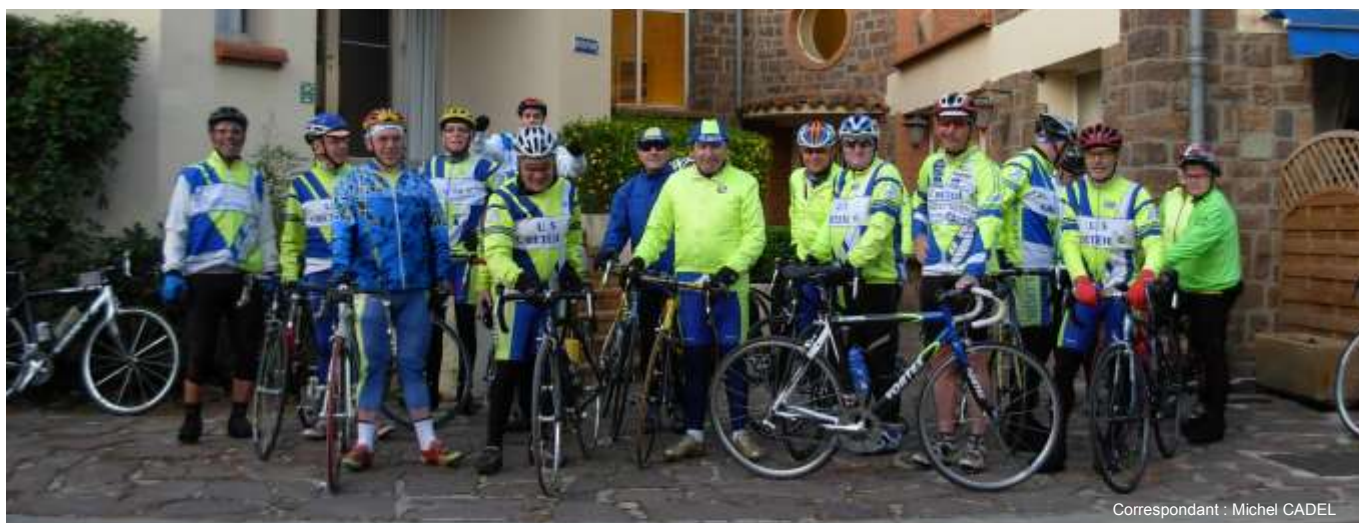
Correspondant : Michel CADEL

Pensant déjà à 2010 (il le faut pour le choix des séjours) nous ferons tout notre possible, sans promesse ferme, pour que le soleil soit des nôtres, mais par contre les participants seront assurés d'une ambiance si particulière de franche camaraderie que savent créer les cyclos de l'US Créteil.