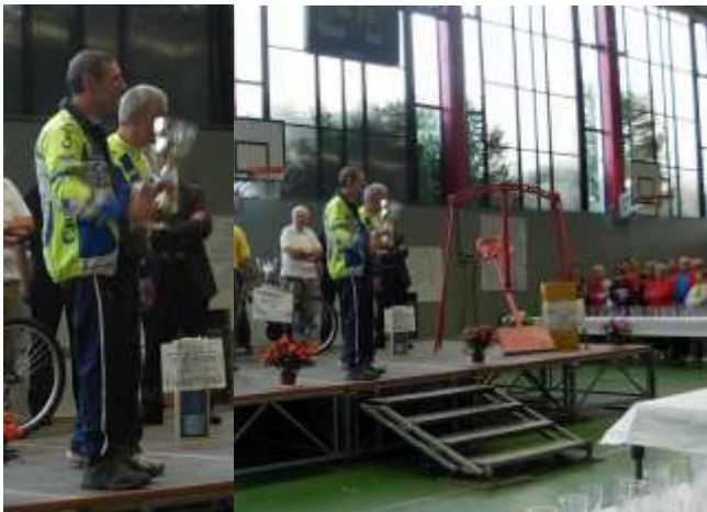
Remise de la coupe pour la 4 ème place de l'US Créteil.

La participation cristolienne a été très forte avec 33 cyclos, 4 vététistes, et 17 marcheuses, ce qui nous a permis d'accéder à la quatrième place, matérialisée par la remise d'une belle coupe.