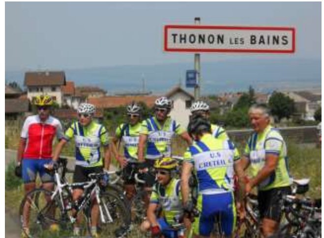
L'arrivée après les 709 kilomètres parcourus.