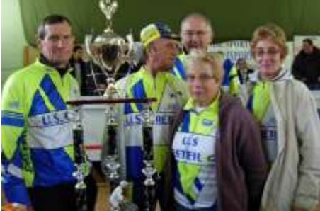
L'US Créteil reçoit le super challenge !

Et puis, lorsque vint la remise des prix, nous avons eu la surprise de remporter pour la première fois le super challenge. Voilà qui réchauffait nos muscles, à moins que cela ne soit le Sancerre...!