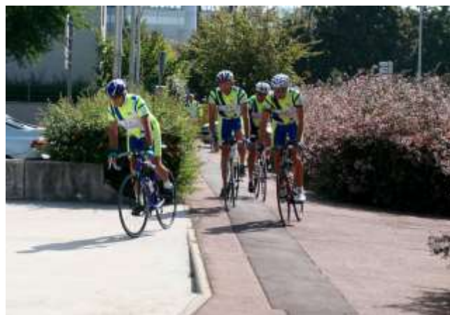
Un groupe de Cristoliens à l'arrivée au Gymnase Nelson Paillou.

A noter une bonne mobilisation de nos adhérents pour organiser cette manifestation de rentrée que nous décalerons de deux semaines l'année prochaine.