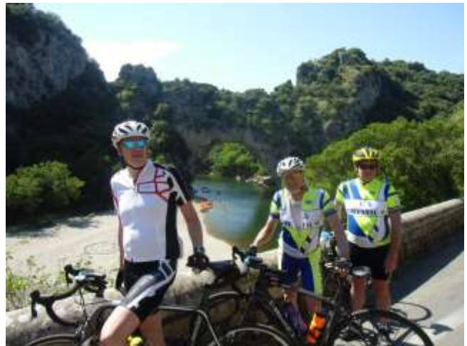
Devant la célèbre arche naturelle de Vallon Pont d'Arc .

Pour une fois, la météo était « plein soleil », et les étangs de Vert le Petit (91) étaient un lieu idéalement choisi. Les cyclos ont parcouru 75 km dans l'Essonne pendant que les randonneurs pédestres découvraient les lieux. Comme d'habitude, le casse-croûte a été très apprécié par la vingtaine de participants. Moment très convivial.