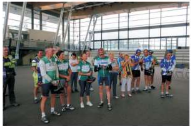
Certains des participants.

bonne constitution lui permit de reprendre le vélo un mois après consolidation de quatre côtes !