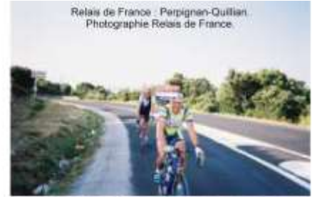
Relais de France : Perpignan-Quillan.

La stratégie fut payante : l'Union Sportive de Créteil se hissait au faite du podium, malgré l'opposition des Rhodaniens de l'A.S.P.T.T.-Lyon, celle aussi des Normands du C.L. Evreux, les uns et les autres candidats au succès final.