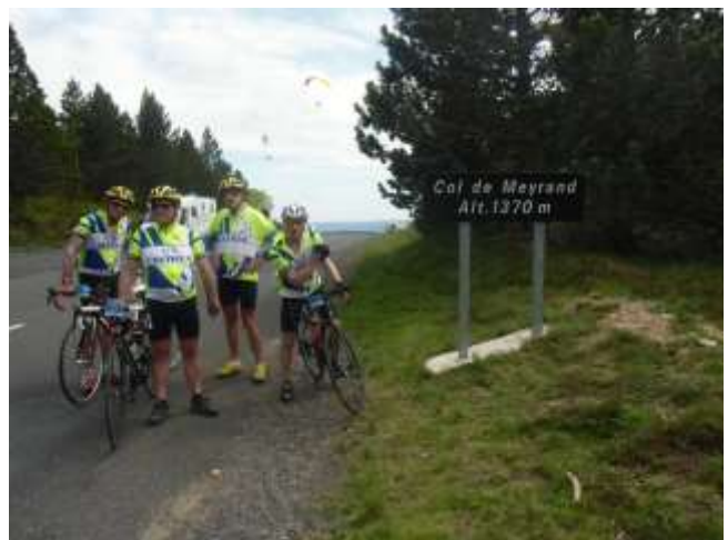
L'Ardéchoise.