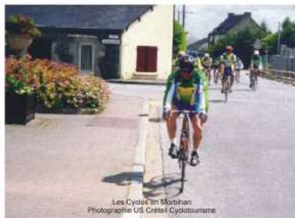
Les Cycles en Morbihan Photographie US Créteil Cyclotourisme

Mes amis je vais poser ici la plume mais je souhaite bien, à l'instar de notre Président, qu'une telle rencontre se reproduise et j'espère alors pouvoir de nouveau faire partie des présents pour revivre avec émotion un bel effort de ce type que je considère comme tout à fait enrichissant.