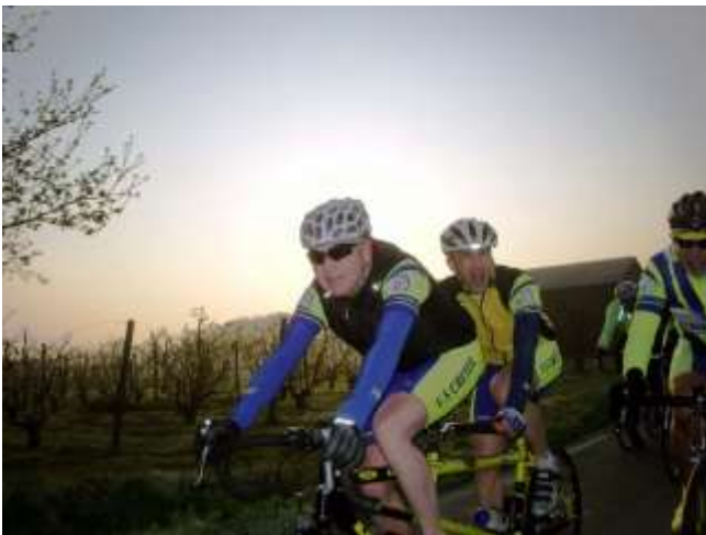
L'équipe ayant remportée la coupe à Mennecy.

Ensuite vient la première place remportée à La Savinienne avec 22 cyclos cristoliens sur 208 km.