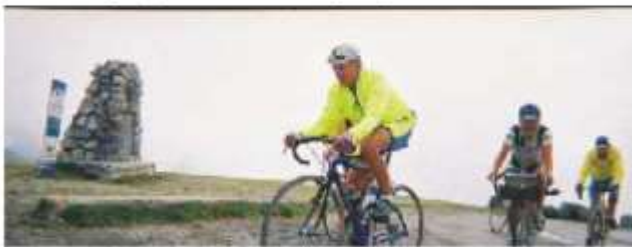
Relais de France : Argelès-Larrau.