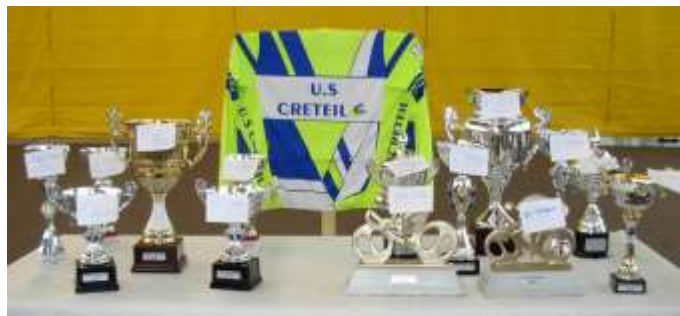
Les récompenses lors de Créteil-Montmirail-Créteil et Créteil-Saint-Augustin-Créteil.

Avec un total de 177 participants, tous très satisfaits d'un parcours bien fléché et de postes de ravitaillement bien achalandés, nous pouvons dire que nous avons assuré !