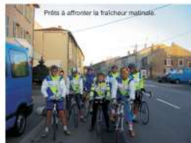
Prêts à affronter la fraîcheur matinale.

... Et parmi eux d'impénitents Cristoliens qui se sont exprimés avec bonheur, notamment ces deux dernières années au point de s'attribuer le trophée sanctionnant la meilleure performance collective.