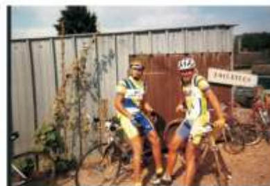
2500 cycloistes engendrent quelques fois une certaine attente pour satisfaire un besoin naturel.

La récompense! Le port et la mer. 210 km d'efforts n'ont pas été effectués en vain.