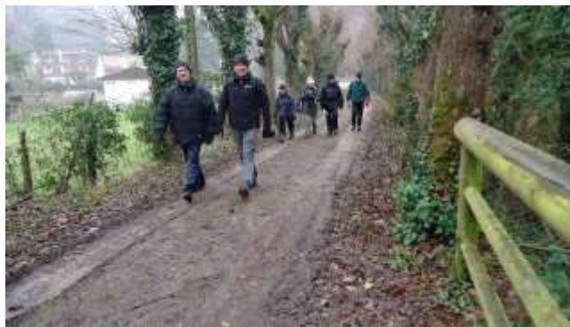
Le chemin Jean Racine au bord de l'Yvette.

Nous espérons tous malgré tout, que le printemps nous permettra bientôt de reprendre notre activité favorite et que la saison 2013 qui va commencer nous verra réaliser d'aussi belles randonnées cyclotouristes qu'en 2012.