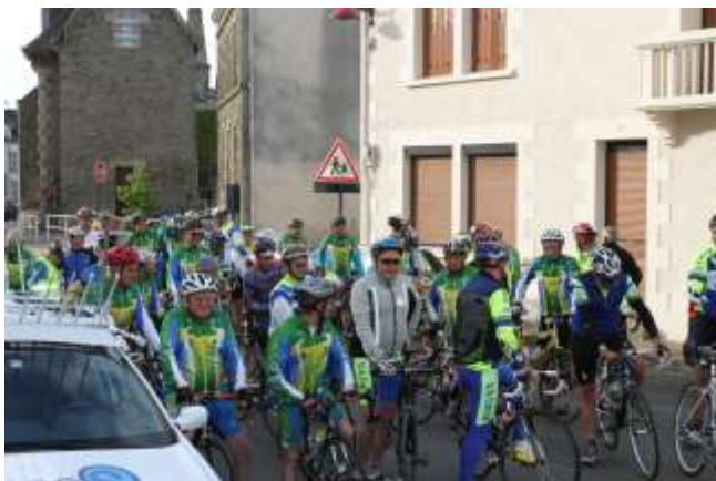
Le départ.

Si les Bretons sont connus pour leur « persévérance », il nous faudra maintenant admettre qu'ils ont aussi un sens très développé de l'accueil.