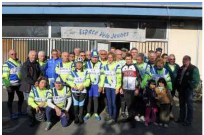
Les participants sous le soleil de cette journée d'automne.