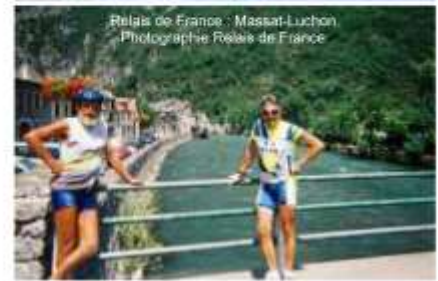
Relais de France : Massat-Luchon.

A l'amorce de la saison 2005, un air de récidive flotte parmi les rangs cristoliens. Les Béliers envisageraient-ils le doublé ? Tout laisse à penser qu'ils pourraient bien concrétiser leurs velléités d'Alsace en Franche-Comté et puis encore en établissant la jonction entre le Golfe du Lion et celui de Gascogne.