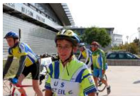
L'arrivée des participants et participantes à Nelson Paillou.

Article extrait du journal « Contacts US » n°65 d'octobre 2009.