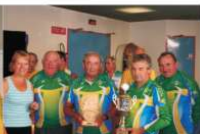
L'équipe de Naizin (Morbihan).