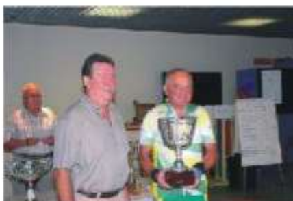
Remises de récompenses de l'ATIF 2006. Photographies Jean MASINGUE - CONTACTS US.

Article extrait du journal « Contacts US » n°54 de décembre 2006.