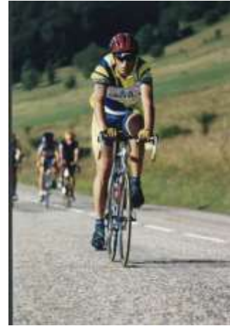
Benoît LARCHEVEQUE LE NIVOLET (152 km - 3300 m de dénivellation) - 29/07/2001 - ST ALBAN-LEISSE (73)

Extrait du journal « Contacts US » n°32 de juillet 2001.