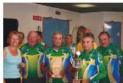
L'équipe de Naizin (Morbihan) récompensée.