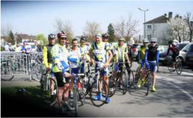
Les participants à Villepreux-Les Andelys-Villepreux.

Mais la plus belle victoire est certainement la première place