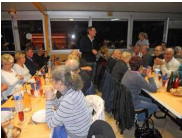
Moment de convivialité du rallye : le diner.

Pourtant, de l'avis d'une grande majorité, nous n'avons pas retrouvé dans cette région l'accueil de Cosne sur Loire, et surtout fait le constat qu'il fallait sans cesse « mettre la main à la poche » pour déguster les produits régionaux. De ce fait, la modération n'était même plus à préconiser... !