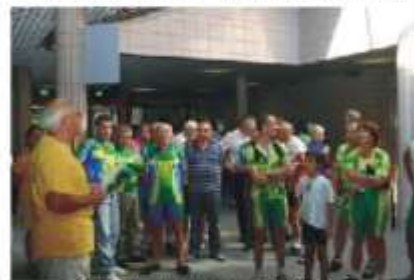
Remise des récompenses de la 34 e édition. © Jean MASINGUE - CONTACTS US.

mobilisés sur cette journée, des statistiques qu'il est agréable de mentionner.