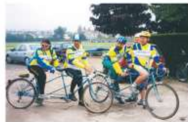
Une autre activité de l'US Créteil Cyclotourisme, celle d'accueillir des non-voyants en tandems.

Les cycloportifs sont en général plus jeunes que les cyclos, ils participent à des randonnées