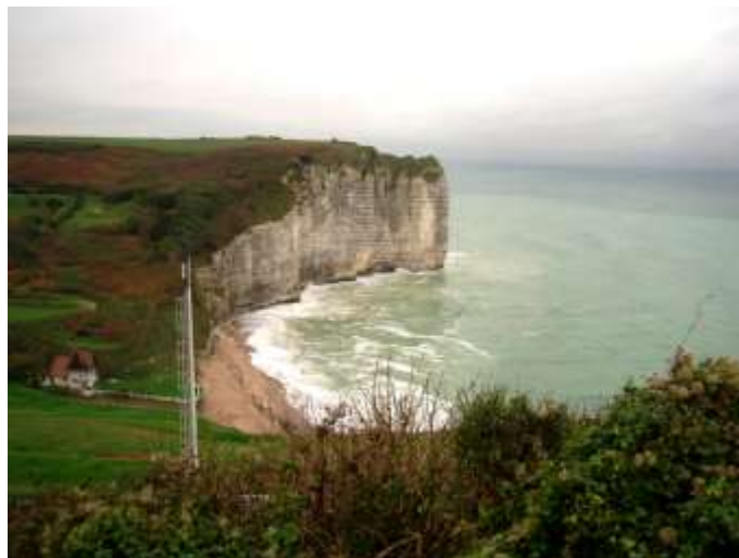
Le Pays de Caux

Un incident survenu à notre véhicule d'assistance a privé certains de la dernière partie du parcours de 80 km, mais le mauvais temps étant revenu il n'y a pas eu trop de regrets.