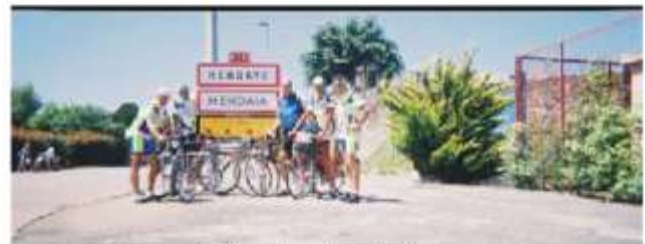
Relais de France : Larrau-Hendaye.