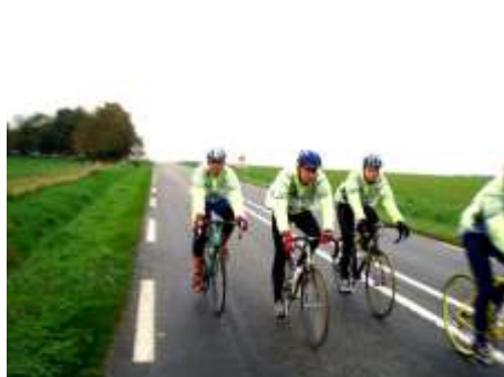
Le groupe des juniors sous la pluie.