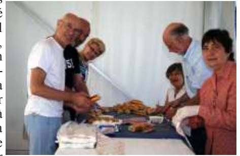
La préparation des sandwich, merci aux bénévoles !

A noter que nous avons regretté l'absence au final de l'AC Sénart, qui était venu en force avec 15 inscrits, mais qui a préféré retourner directement à l'ombre de sa forêt plutôt que de revenir chercher des honneurs au Stade Duvauchelle où le thermomètre était grimpé, il est vrai, très haut.