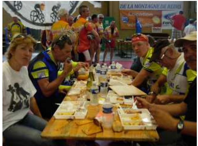
Reims, après l'effort le réconfort.