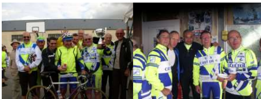
Correspondant : Roland TROKIMO

Un hommage fut rendu à Raymond et Lucien DUPRÉ, avant de se séparer au terme d'une matinée bien remplie et en se promettant de renouveler cette manifestation placée sous le signe de la convivialité.