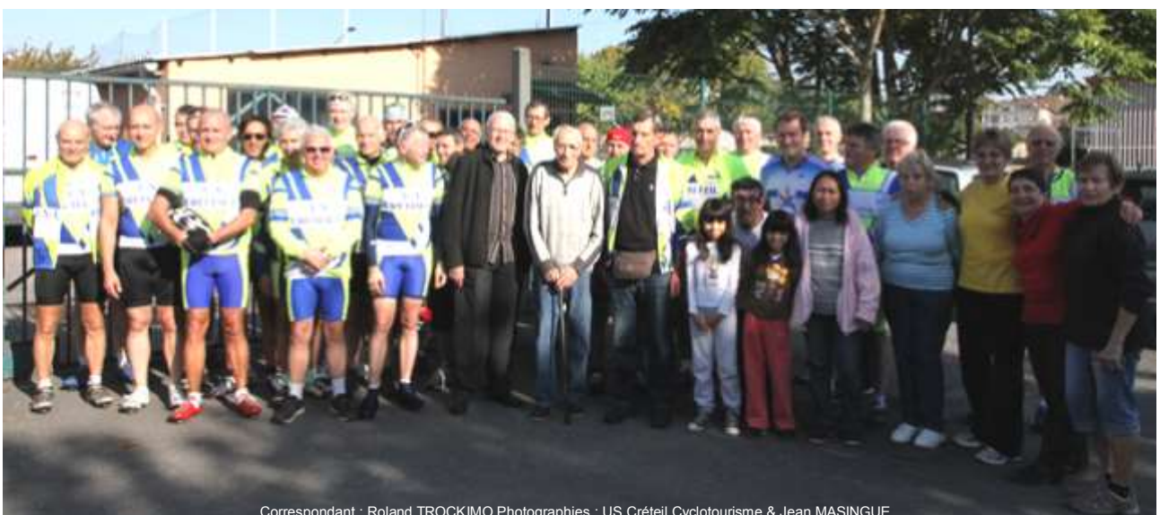
Correspondant : Roland TROCKIMO